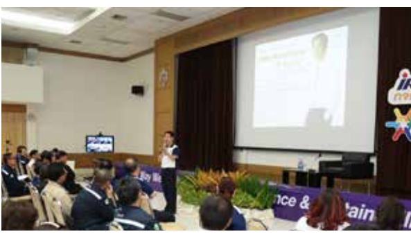
กรรมการผู้จัดการใหญ่พบพนักงาน

Environment, Quality & Productivity และ Technical รวมถึงการอบรมจริยธรรมในการดำเนินธุรกิจ และการต่อต้านการทุจริตคอร์รัปชันตามนโยบายของบริษัทฯ นอกจากนี้ มีการจัดทำแผนพัฒนารายบุคคล (IDP) ระหว่างพนักงานร่วมกับผู้บังคับบัญชา เพื่อสร้างแรงจูงใจในการพัฒนาตนเองและพัฒนาสายอาชีพที่เหมาะสมและมีประสิทธิภาพ โดยบริษัทฯ ได้กำหนดเป้าหมายจำนวนชั่วโมงการฝึกอบรมเฉลี่ยของพนักงานต่อปีในแต่ละระดับตำแหน่งงาน ซึ่งได้มีการเปิดเผยสถิติดังกล่าวไว้ในรายงานความยั่งยืน