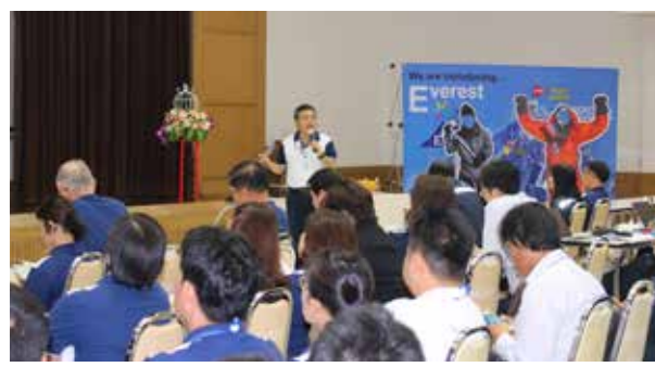
การประชุมสัมมนาโครงการ EVEREST

- กำหนดนโยบายค่าตอบแทนพนักงานที่เป็นธรรมสอดคล้องกับผลการดำเนินงานของบริษัทฯ ทั้งในระยะสั้นและในระยะยาว โดยมีการตกลงกันในการกำหนดตัวชี้วัดระดับ