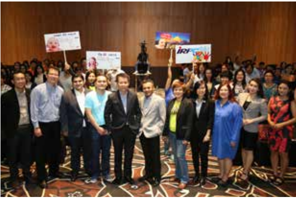
กรรมการผู้จัดการใหญ่พบนักลงทุนและสื่อมวลชน