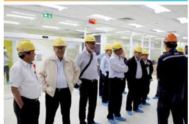
คณะกรรมการบริษัทฯ ตรวจสอบการก่อสร้างโครงการ UHV ที่เขตประกอบการอุตสาหกรรมไออาร์พีซี จังหวัดระยอง

ในปี 2558 บริษัทฯ ได้เพิ่มการประเมินกรรมการบริษัทฯ และกรรมการชุดย่อยโดยผู้ประเมินอิสระ (Independent Assessment) และมีแผนการประเมินอย่างน้อยทุก 3 ปี