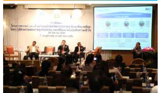
งานเสวนาการดำเนินงานด้าน CSR ด้านทรัพยากรธรรมชาติและสิ่งแวดล้อม