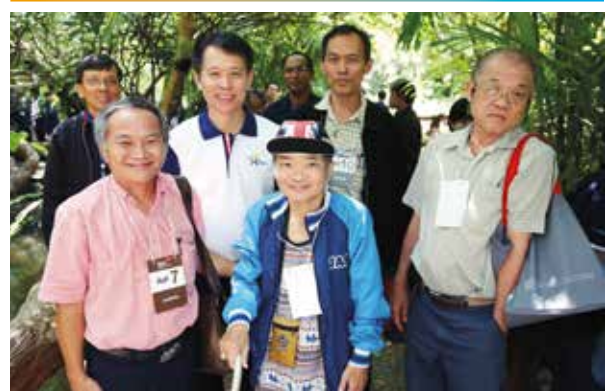
ผู้ถือหุ้นเยี่ยมชมกิจการ

S : Social การจ้างแรงงานท้องถิ่น สนับสนุนชุมชนท้องถิ่น จัดซื้อจากคู่ค้าที่มีแนวปฏิบัติที่เคารพสิทธิมนุษยชน