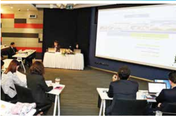
การประชุมนักวิเคราะห์หลักทรัพ์