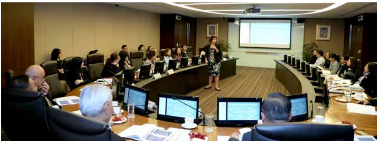
การบรรยาย The Board's Room in Strategic Formulation

กรรมการชุดย่อย เลขานุการบริษัท และเลขานุการคณะกรรมการชุดย่อย เพื่อยกระดับการกำกับดูแลกิจการที่ดีของบริษัทฯ ให้เข้มข้นขึ้นต่อไป