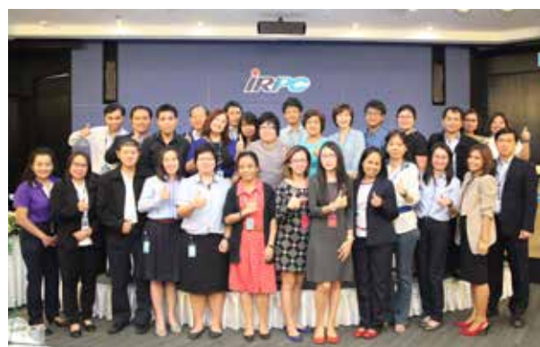
งานสัมมนาหลักสูตรการบริหารความเสี่ยงด้านการปฏิบัติตามกฎเกณฑ์

ในการดำรงตนเป็นพลเมืองโลกที่ดีและพัฒนาอย่างยั่งยืน เช่น UN Global Compact เป็นต้น และจัดพิมพ์ใหม่มอบ ให้บุคลากรทุกระดับของบริษัทฯ และบริษัทในเครือเซ็นทรัลรับ และให้ค้ำประกันว่าจะปฏิบัติตาม