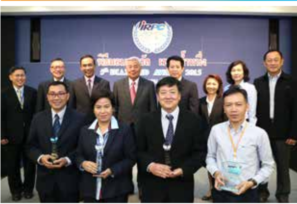
คณะกรรมการตรวจสอบ มอบรางวัลเพชรน้ำหนึ่งให้หน่วยงานที่มีการควบคุมภายในดีเด่นเพื่อสนับสนุนการปฏิบัติงานอย่างโปร่งใส มีระบบควบคุมที่มีประสิทธิภาพ